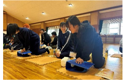
安全管理で実施した普通救命講習