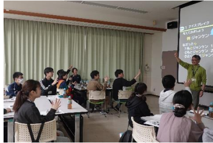
青少年教育について