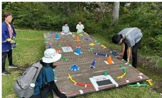
「どんぐりコロコロレース」