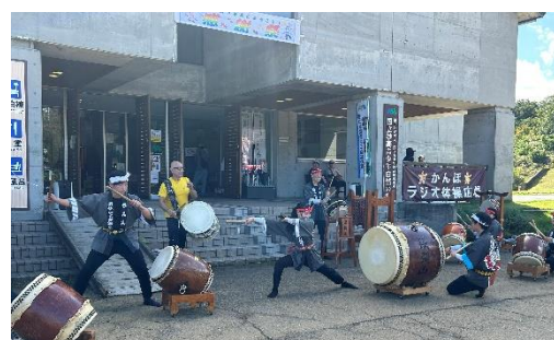
お昼のセレモニー 「妙高高原須弥山太鼓保存会」太鼓演奏