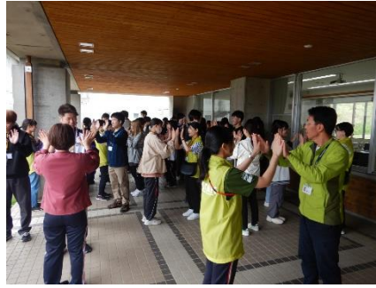
体験学習法の理解