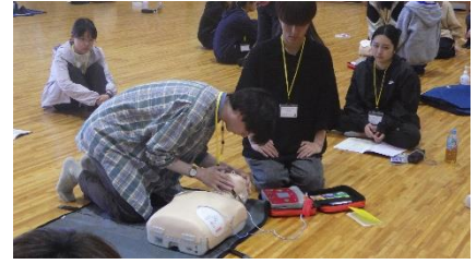
安全管理で実施した普通救命講習