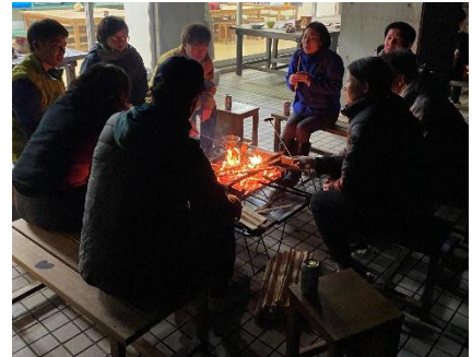
焚き火を囲んでの交流