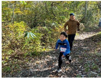
トレイルランニングレース本番