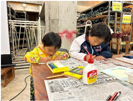
マイ参加賞づくり