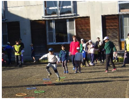
リングを使った練習