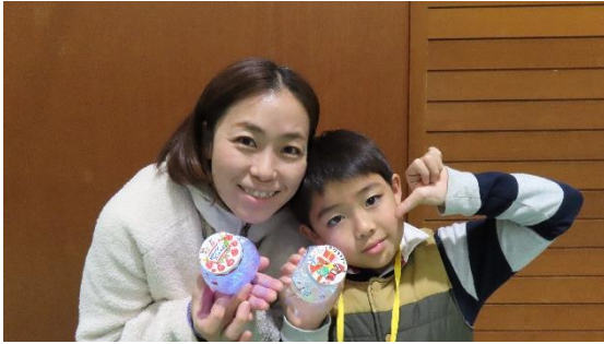
きれいなライトが完成！