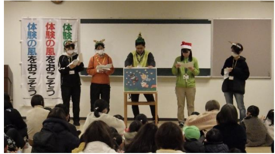
早ね早起きの紙芝居を読みました