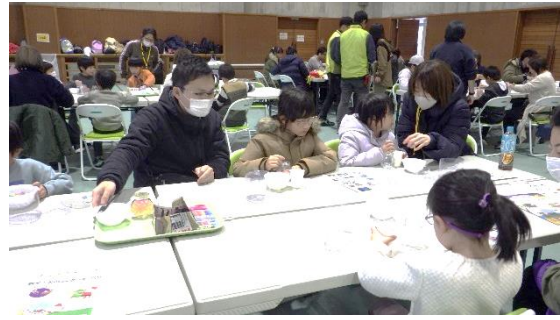
ジェルライトづくりの様子