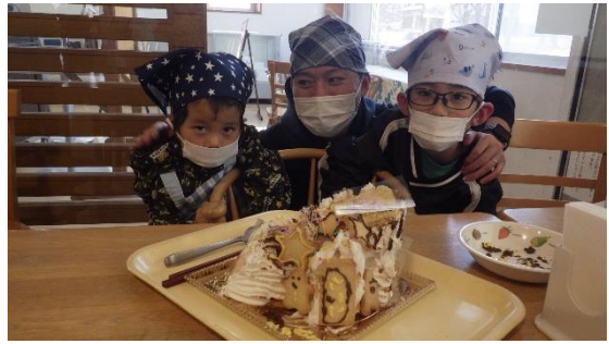
オリジナルケーキ完成！