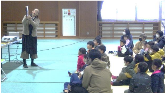
絵本の読み聞かせに夢中