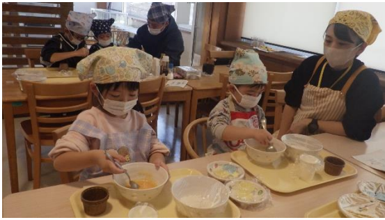
自分の力でケーキづくり