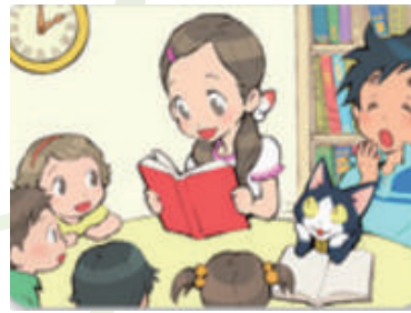
子どもの読書活動を支援