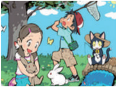
子どもの体験活動を支援